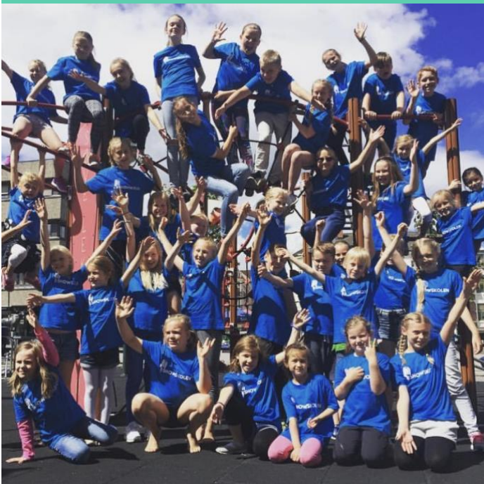
Utetiden tilbringes bl.a. på de flotte lekeapparatene på Søndre torv.